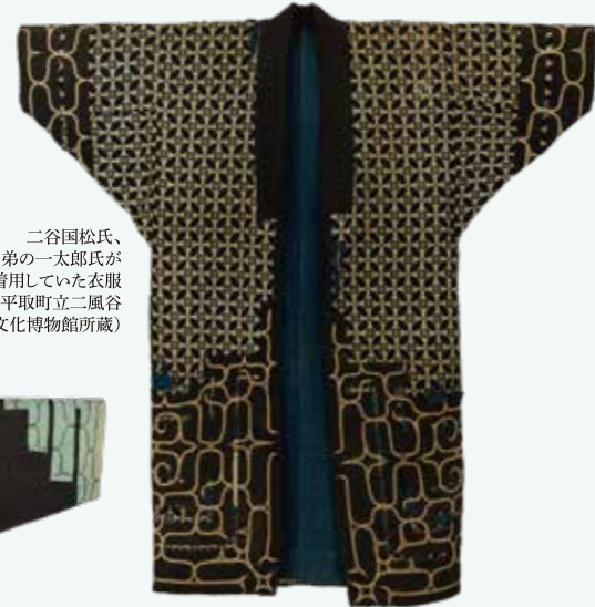
二谷国松氏、 弟の一太郎氏が 着用していた衣服 (平取町立二風谷 アイヌ文化博物館所蔵)