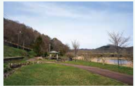
平村ベンリウク氏らの写真が撮影された地点の現在の景観 2026年 河川改修により流れが大きく変わり、現在は遊歩道が整備されている。