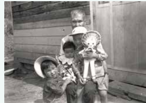
三人の孫に囲まれた晩年の二谷国松氏(北海道博物館所蔵)