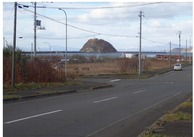
3 室蘭市絵鞆町から大黒島を望む