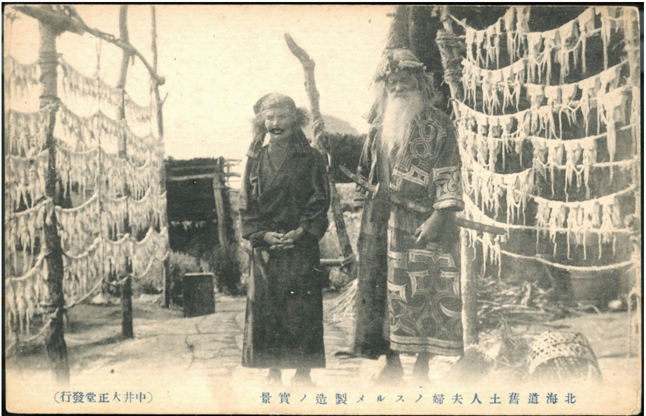
1 金田一京助旧蔵絵葉書 No.222