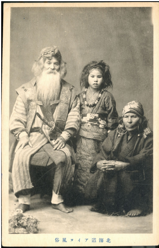
1 金田一京助旧蔵絵葉書 No.62