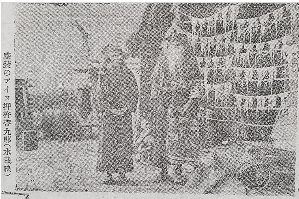
2 坪谷水哉「一日一信」掲載写真