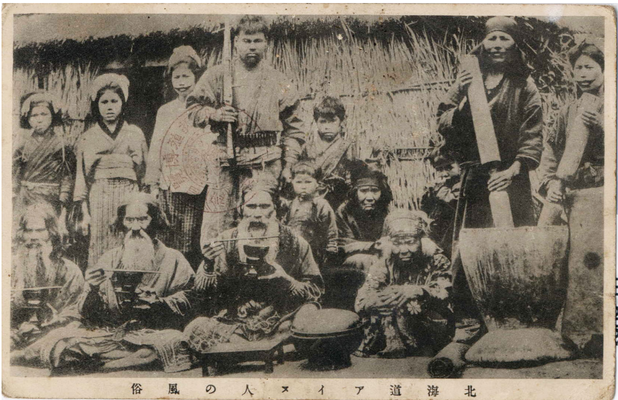
北海道アイヌ人の風俗

2 写真絵葉書 (新妻達雄氏蔵) 前列左から1人目が図4-1左から2人目、同2人目が左から3人目と同一人物