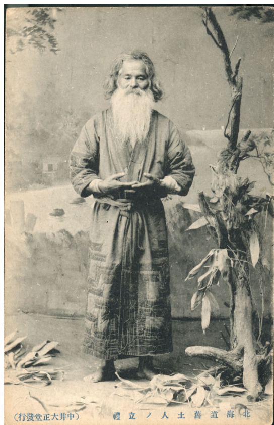
1 金田一京助旧蔵絵葉書 No.219