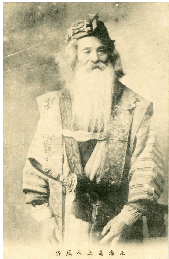
4 写真絵葉書