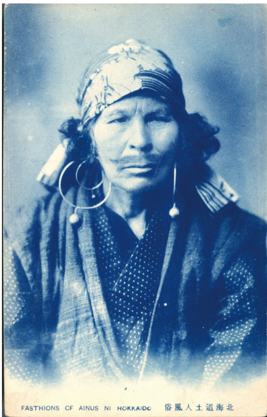
3 金田一京助旧蔵絵葉書 No.126