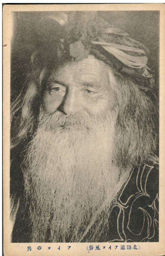
3 金田一京助旧蔵絵葉書 No.48