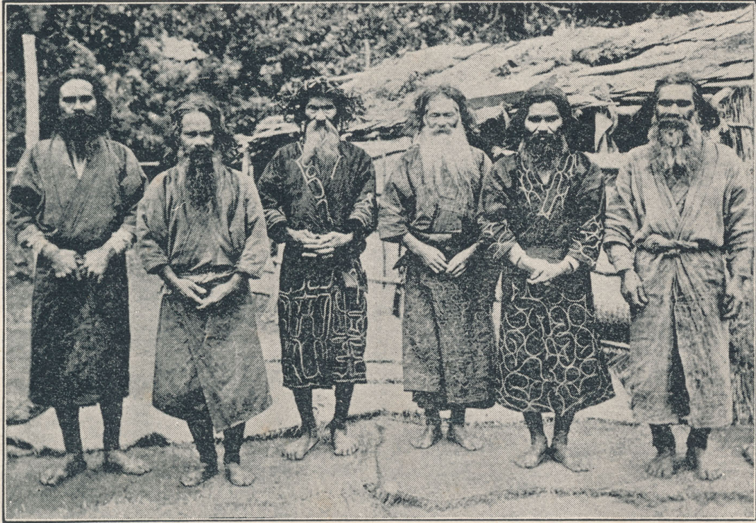
The picture, Aino Congregation.