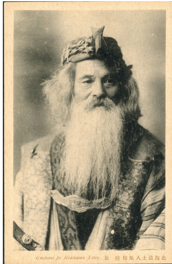
2 金田一京助旧蔵絵葉書 No.95