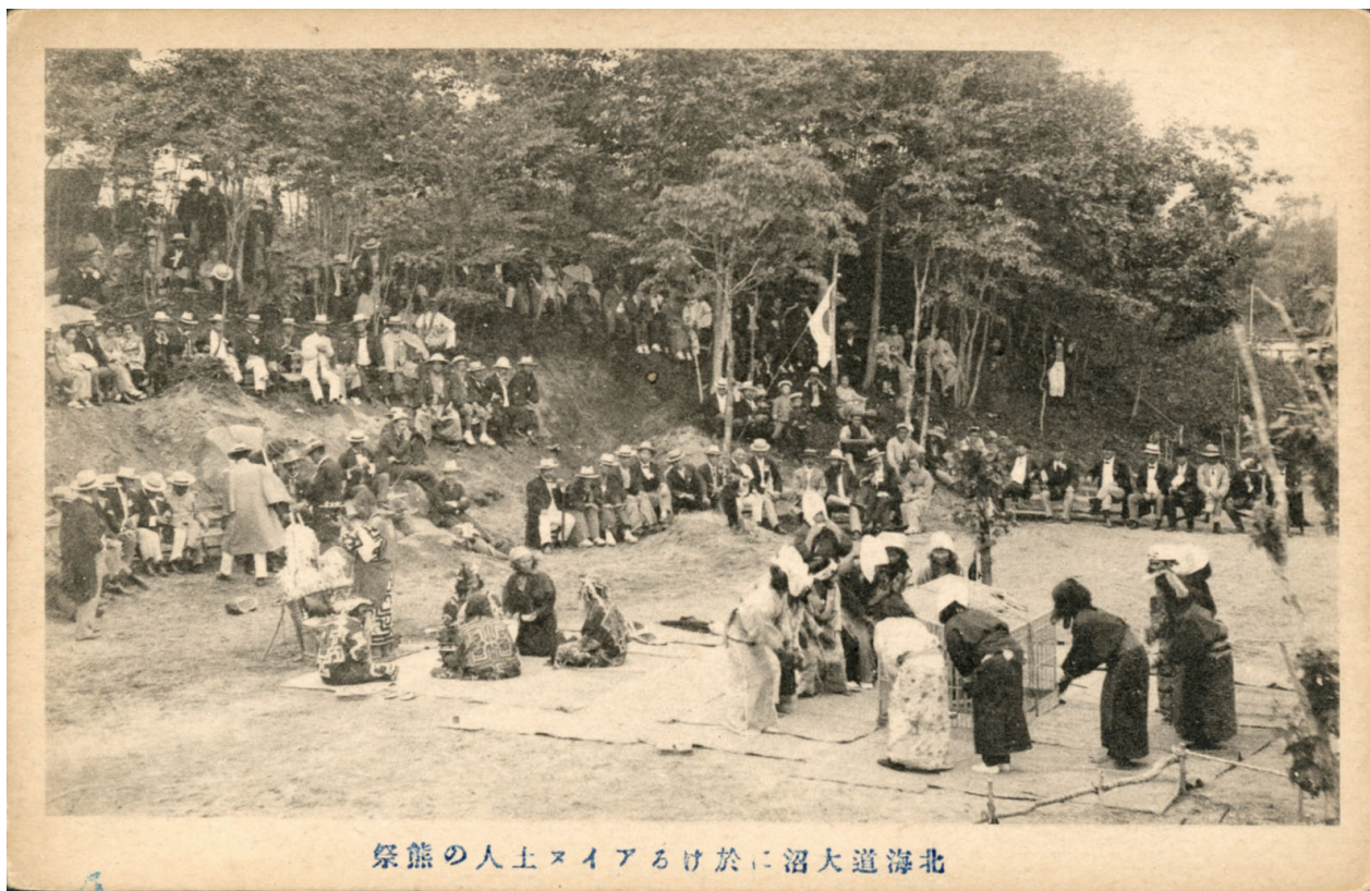
1 金田一京助旧蔵絵葉書 No.238