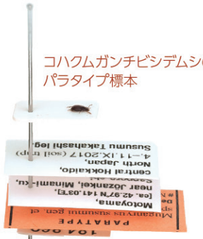
コハクムガンチビシデムシのパラタイプ標本