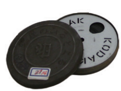
戦前・戦後の札幌を写した8mm映画フィルム