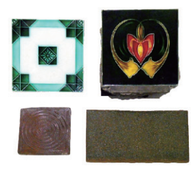
「すまい」を彩るタイル