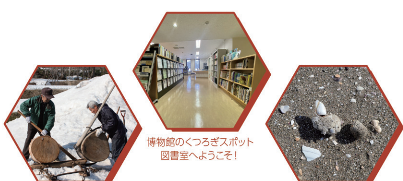
〈トビ〉など「馬追いの道具」の使い方を再現した映像