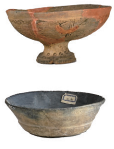
擦土土器 高坏(上)と坏(下)