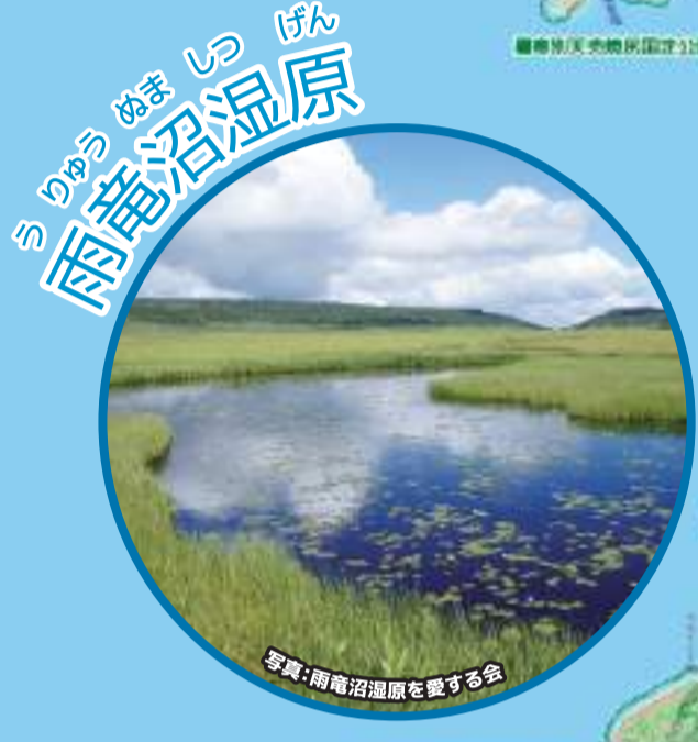
rain dragon 雨竜沼湿原