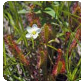
ナガバノモウセンゴケ (サロベツ・エコ・ネットワーク)