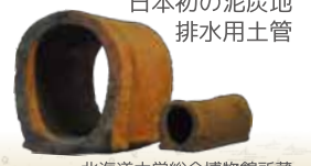
日本初の泥炭地 排水用土管 北海道大学総合博物館所蔵