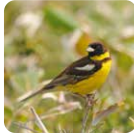
シマアオジ (サロベツ・エコ・ネットワーク)