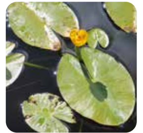
ウリュウコウホネ (雨竜沼湿原を愛する会)