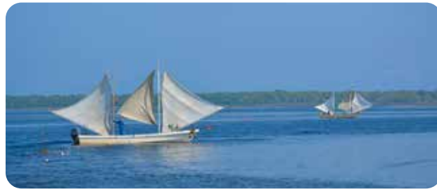
打瀬舟の北海しまえび漁 (野付半島ネイチャーセンター)

バス 新札幌駅から バスターミナルのりば@ジェイ・アール 北海道バス新22「開拓の村」行き「北海道博物館」下車 森林公園駅から 東口のりば 上記のバスに乗車 徒歩 森林公園駅から20～25分 お車 駐車場あり(無料)