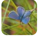
カラフトトリシジミ