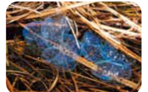
キタサンショウウオの卵