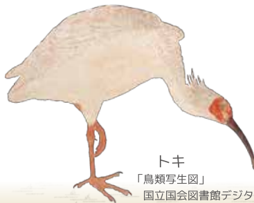
トキ 「鳥類写生図」