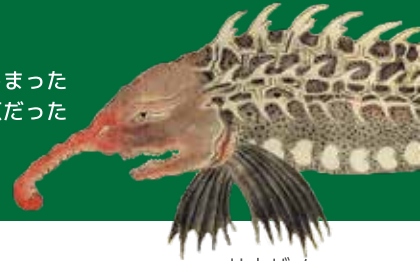
サウザメ (チョウザメ!?) 「異魚図賛」

湿原、沼、川、湖、干潟... 北海道は湿地の宝庫！ 歩いて、感じて、学べる展示が北海道博物館に出現します。 湿地で見られる鳥や魚、昆虫や植物、そして幻になってしまった 生きものたちが大集合。さらに、かつては日本最大の湿原だった 石狩大湿原の開拓など、あなたの足下にもきっと 埋まっている湿地の歴史を掘りおこします。