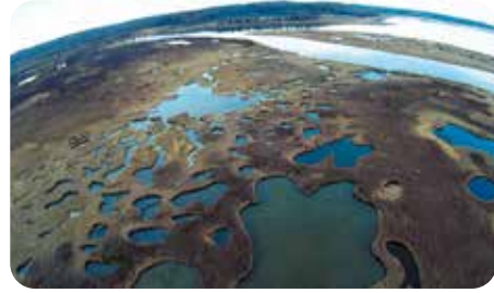
沼だらけの湿原 (サハリン、ロシア)