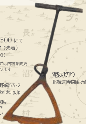
泥炭切り