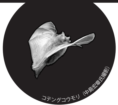
コテンゴコウモリ

日がしずむと森の動物たちは元気に動きはじめます。 北海道博物館に出現した夜の森を探検しよう！ やみに光る目、草をふむ音、空をわたる影。 さあ、こわがらないで。 いつもは見ることのできない動物たちのすがたを そつとのぞいてみませんか？