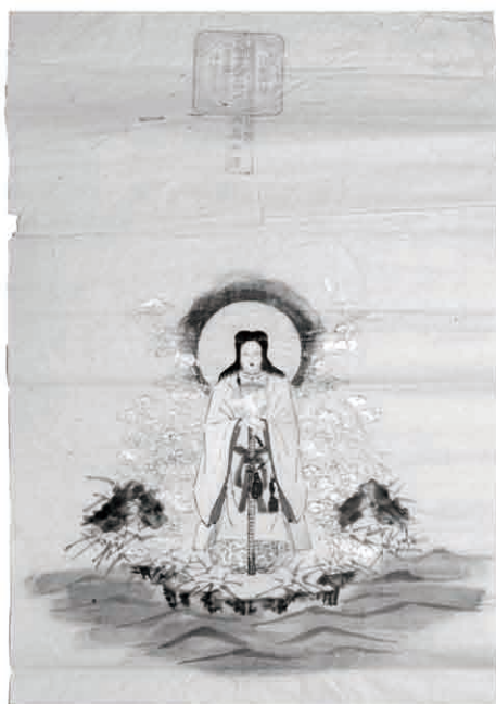
粟島大神像 明治期