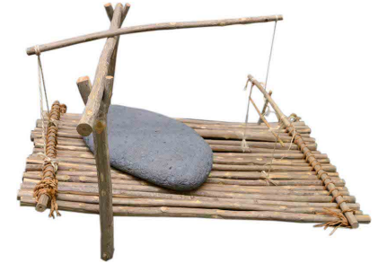
2-2-1 小型の動物をとるための罠