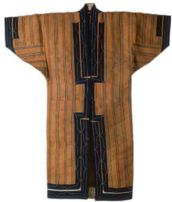
2-2-2-1 伝統的な衣服① 樹皮衣