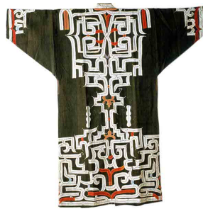
2-2-2-2 伝統的な衣服② 木綿衣