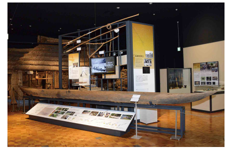
2-2-1 丸木舟の展示風景