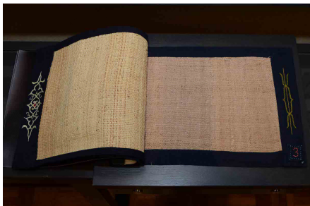
2-2-2-4 樹皮衣ハンズオン