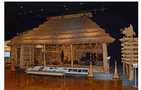
2-2-4 アイヌの昔の家屋