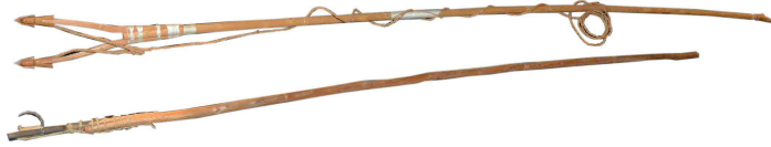
2-2-1 マレク (下)