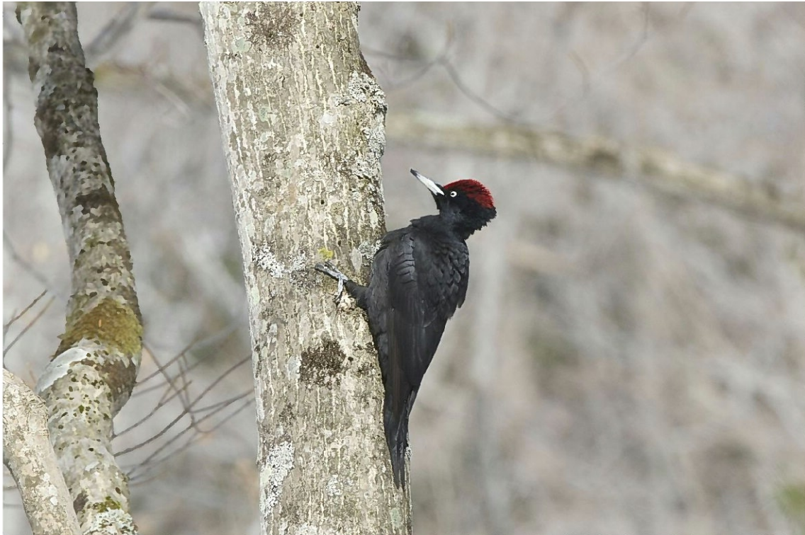
No. 41 メッシュで確認されたクマゲラ雄 2017.3.4

この度は「野幌森林公園クマゲラー斉調査2017」のご参加ありがとうございました。お陰様をもちまして、昨年同様にクマゲラの確認羽数も6羽と好結果で大変嬉しく思います。私たちはクマゲラ調査をはじめ、野幌の豊かな森を守る為の活動を続けたいと考えておりますので、今後ともご支援ご協力の程よろしくお願い申し上げます。