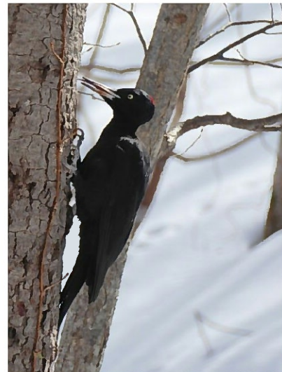
(12 メッシュ)