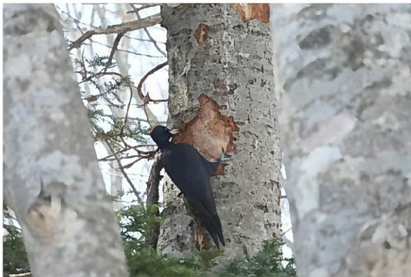
(81 メッシュ)